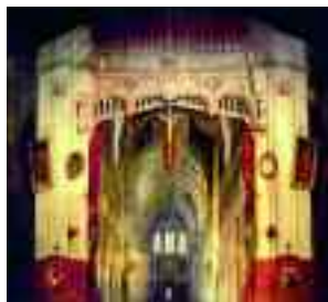
Le diorama de Daguerre (précurseur de la photographie), à Bry-sur-Marne.

Comme chaque année, le Festival d'Île-de-France propose un ensemble de concerts dans les lieux du patrimoine francilien : musique classique, traditionnelle, ou création contemporaine avec une série Factory axée sur le jazz et les musiques électroniques. Du 3 sep-