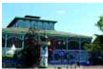
Le pavillon Baltard à Nogent-sur-Marne, lieu voué à l'organisation d'événements privés et publics.

du Val-de-Marne et de la Seine-Saint-Denis, incitera sans aucun doute les entreprises, organisateurs d'événements et salariés à venir découvrir ou mieux connaître les richesses du territoire.