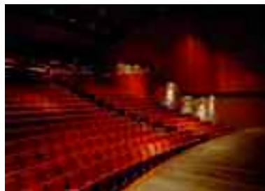
Le théâtre des Deux rives à Charenton-le-Pont.