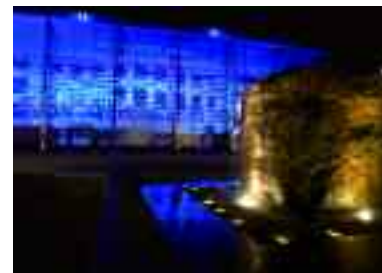
L'Espace Michel-Simon à Noisy-le-Grand.

Sébastien Brousseau - Ville de Noisy-le-Grand.