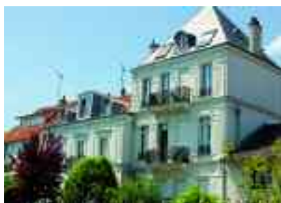
Pavillons des bords de Marne.

et de réflexions. Ce groupe entend développer la diffusion de l'offre existante et tisser des liens solides entre les collectivités. La mutualisation de la diffusion culturelle, via la mise en ligne d'un agenda, témoigne de l'offre conséquente et pertinente disponible à proximité pour les habitants (conservatoires, théâtres, cinémas...). Ainsi, lorsque le festival "L'industrie du rêve" est auditionné pour être présenté dans plusieurs villes de l'ACTEP, le pari est réussi. La