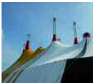
Le cirque traditionnel de Rosny-sous-Bois.