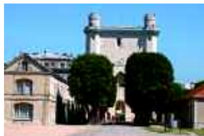
Le donjon récemment rénové ouvrira au public à la rentrée.

concrétisation d'une telle démarche démontre l'intérêt pour les collectivités de partager leurs expériences et leurs actions. Une aubaine pour la population, qui bénéficiera d'une telle collaboration via des projets plus ambitieux, enfin à la portée des budgets communaux. Toutes les communes ne sont pas également actives. Les villes motrices devraient créer une dynamique. Si chaque ville