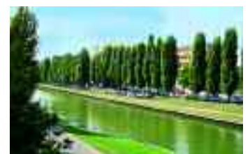
Les rives aménagées du canal de l'Ourcq à Bondy.