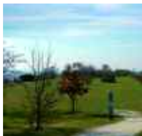
Le parc du coteau d'Avron.