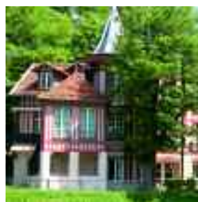
Le conservatoire de musique sur l'île Fanac à Joinville-le-Pont.