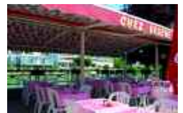
La guinguette, héritage des loisirs du XIX e siècle.

La "planète Eureka" à Champigny-sur-Marne, la maison de la Marne à Nogent-sur-Marne, le réaménagement du port de plaisance de Neuilly-sur-Marne et la création d'un port à Noisy-le-Grand sont des projets séduisants à la disposition des habitants, des Franciliens et des